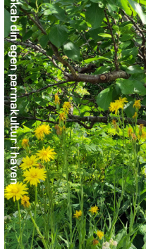
Skab din egen permakultur i haven