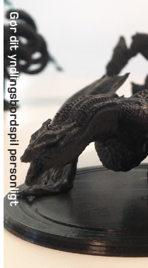
Gør dit yndlingsbordspil personligt