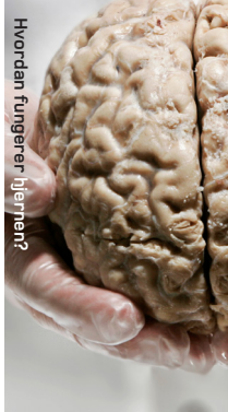
Howdan fungerer hjernen?