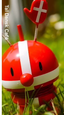
Tal Dansk Café