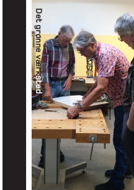
Det grønne værksted