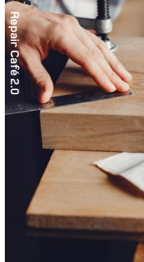
Repair Café 2.0