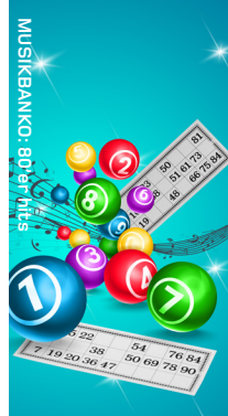
MUSIKBANKO: 80'ER HITS