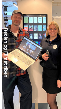
Hjælp til e-Reolen og Filmstriben