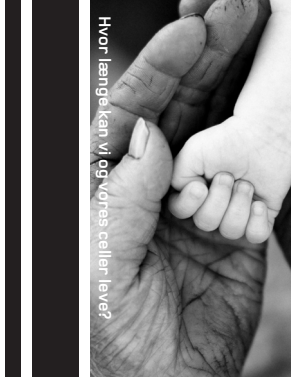
Hvor længe kan vi og vores celler leve?