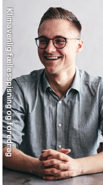
Klimavenlig fællesspisning og foredrag