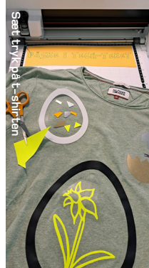
Sæt tryk på t-shirten