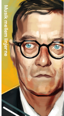
Musik mellem linjerne