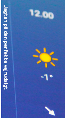
Jagten på den perfekte vejrudsigt