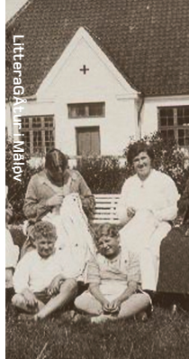
LitteraGÅtur i Måløv