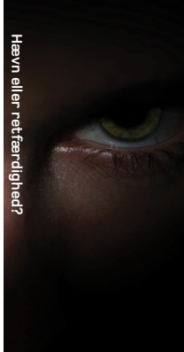
Hævn eller retfærdighed?